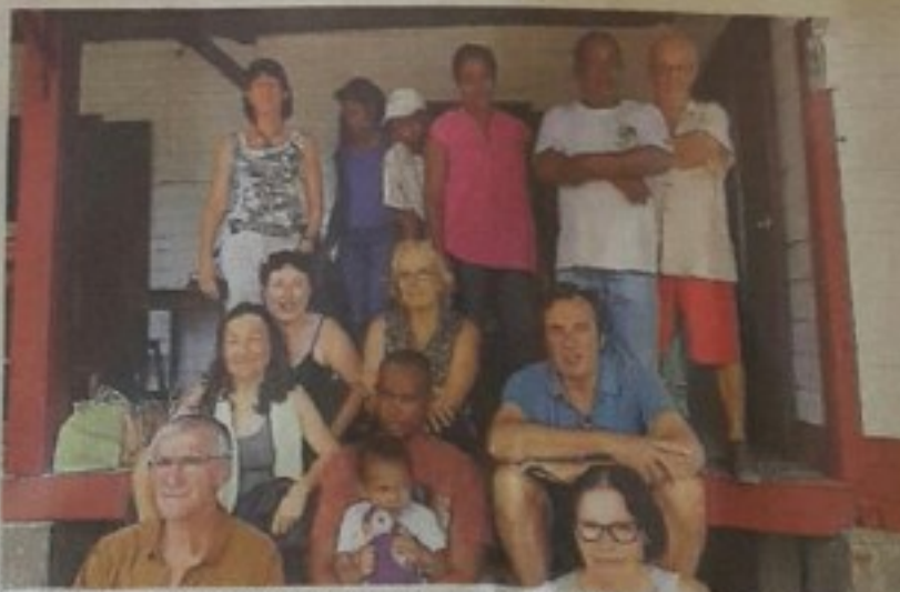
Des membres de l'association saumuroise Kibouj s'étaient rendus en novembre dernier à Madagascar, lors du baptême du bateau.